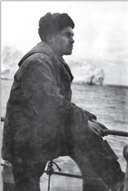
Ким на борту

всматривается вперёд вахтенный. А впереди много опасностей! Огромные айсберги усеяли океан, стали на пути корабля плавучие льдины едва заметные, ночью почти сливающиеся с водой. Трудно различить даже вблизи. На вахте стоишь всё время в напряжении.