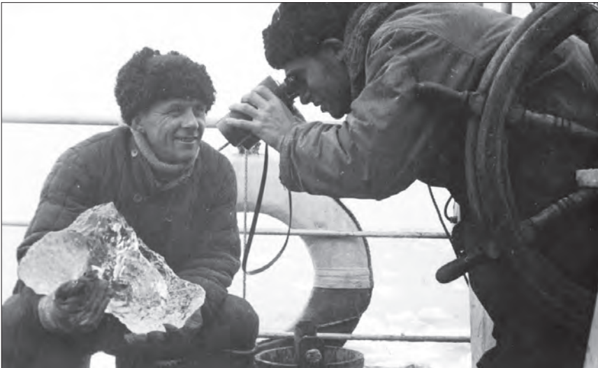
Ким разглядывает лёд в бинокл

Меньше суток море было относительно спокойным и снова заштормило. Команда не успевает отбивать лёд. Каждые 3–4 часа многотонная ледяная тяжесть давит на китобоец,