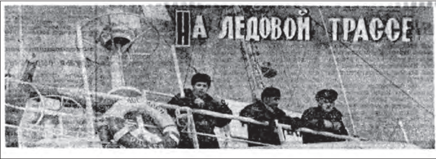
Газета Моряк. «На ледовой трассе»

за часом, день за днём. За ночь пройдено 2 мили, а ночь зимняя длинная. Во льду застряли десятки судов. У одних кончилась вода, у других топливо, «Съеден последний сухарь», — вопит радиограмма с третьего. Всем нужно помочь дойти до порта ввести в порт.