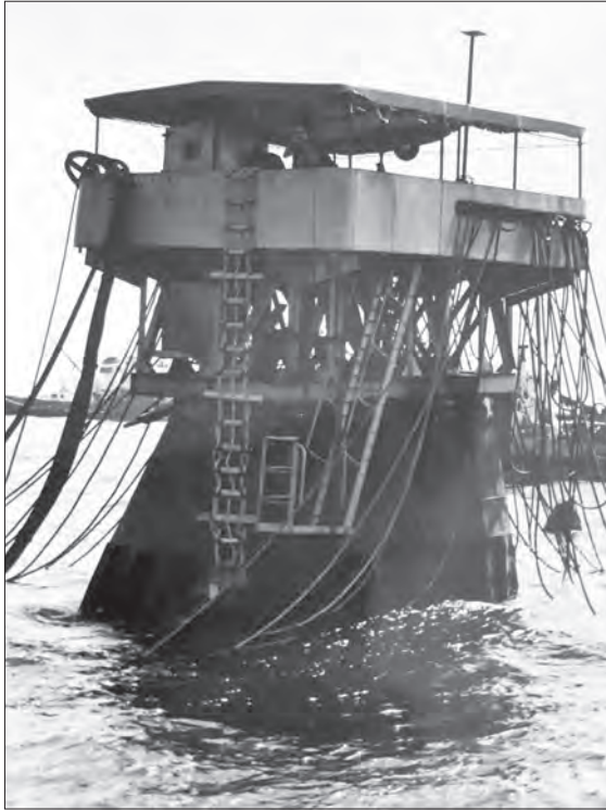
Поднятие «Моздока». Ким на трубе с секстантом.

Лоцман на трубе... Это почти что скрипач на крыше. То же соло над миром, окруженным стихиями неба и вод, то же смешение улыбки и грусти в поступке, то же одиночество духа и объединение души со вселенной. Таким ты остался навеки в истории города.