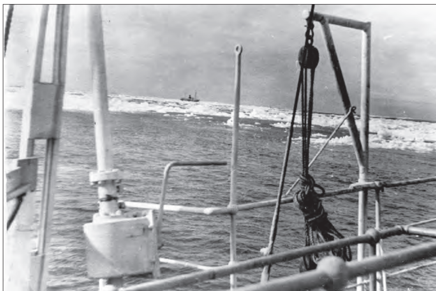
Льды и айсберги