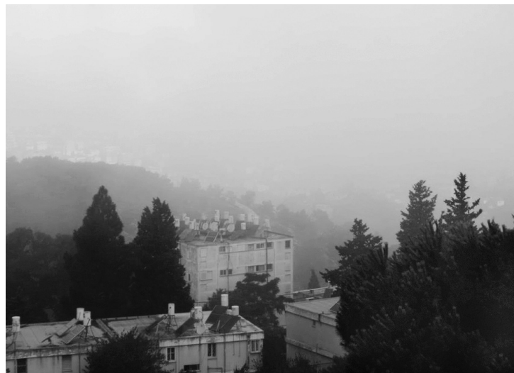
Верхний Назарет. 2013 г.

Я думаю о них, смотрю на их фотографии. Нет, не подумайте, что они далеко; они здесь, они в реале,