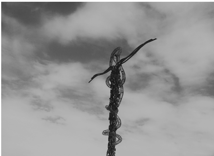
Гора Небо. Март, 2013 г.

и плохом, что совершал и о чем не знал, что совершал. После страшного, многолетнего отчаяния я почувствовал столько любви, словно был я уже не человек... Потому что потом я спрашивал самого себя: может ли человек вместить в себя столько любви, сколько вместил ее я тогда, в течение нескольких минут?