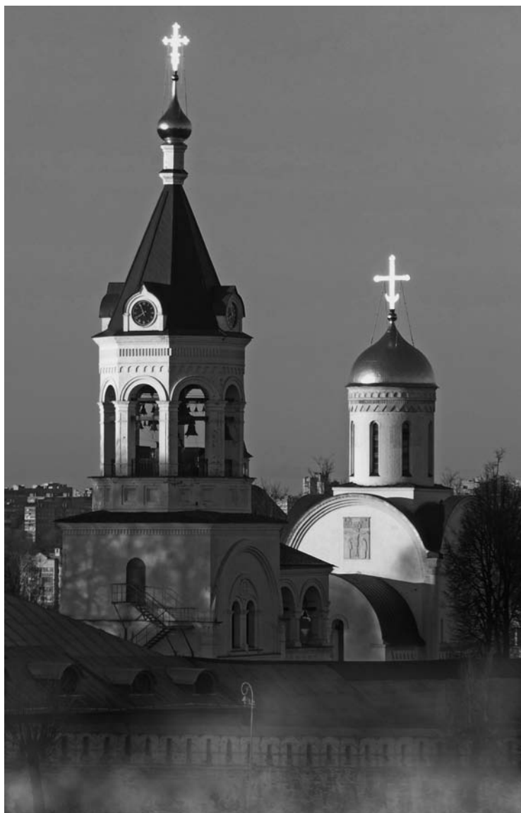
Богородице-Рождественский монастырь во Владимире