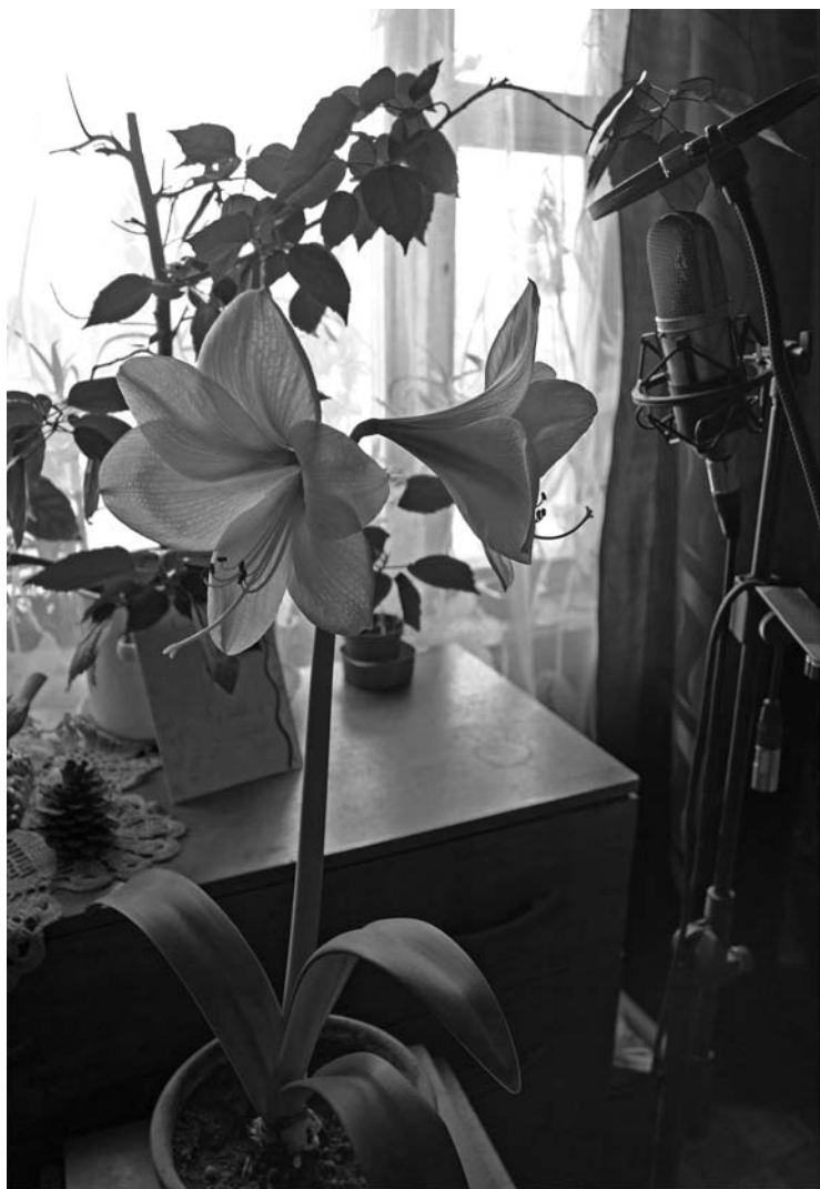
Весенняя песня цветка