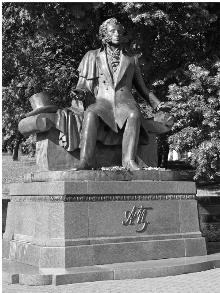
Памятник А. С. Пушкину в Минске