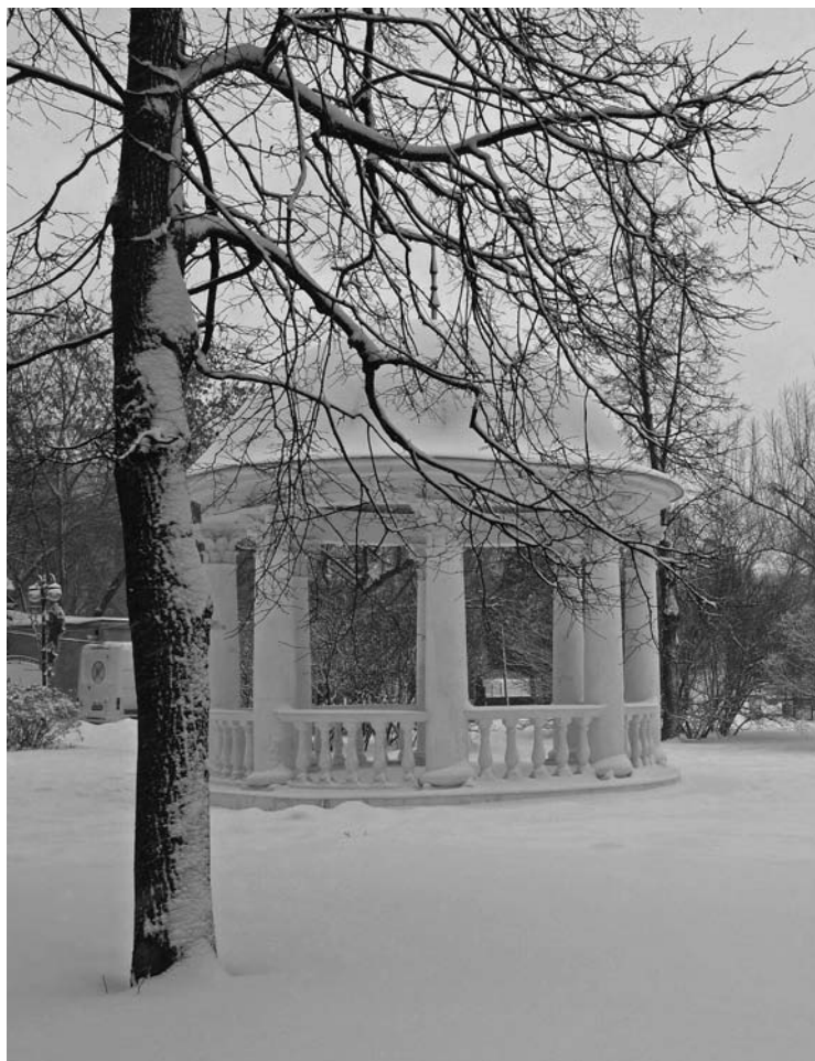
Ротонда в Екатерининском парке Москвы