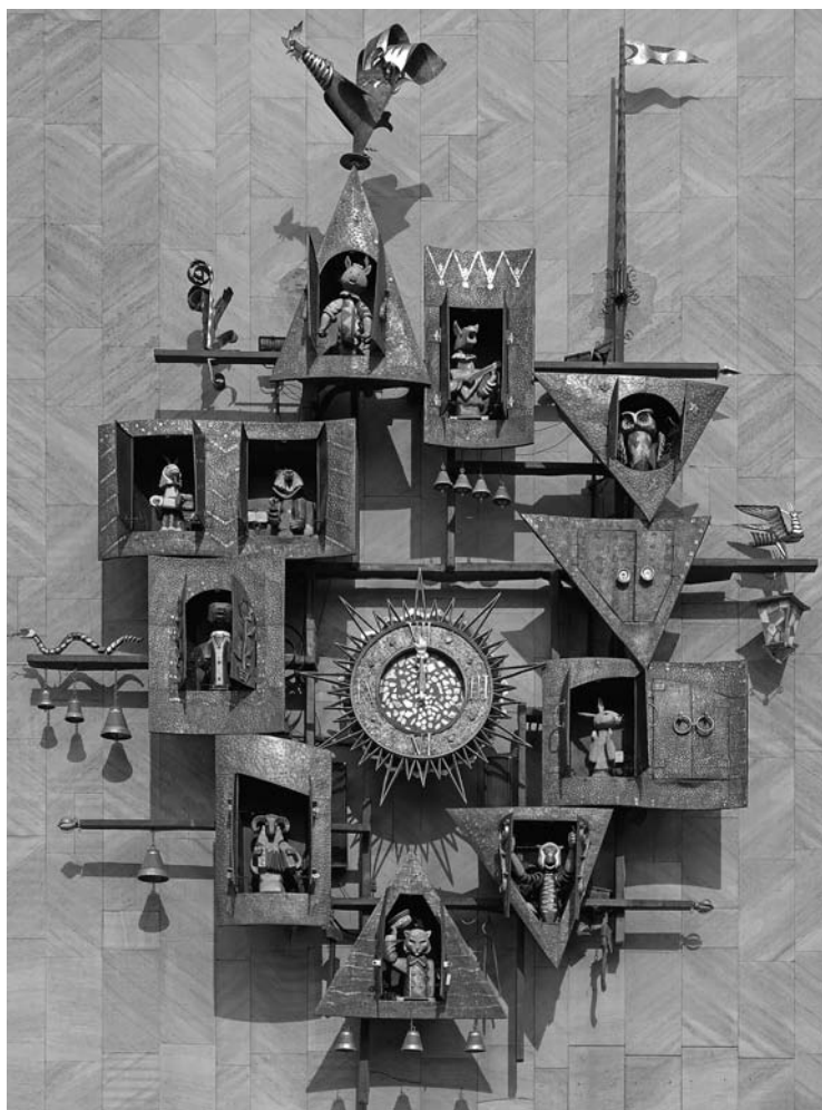
Часы на главном фасаде Государственного академического центрального театра кукол имени С. В. Образцова